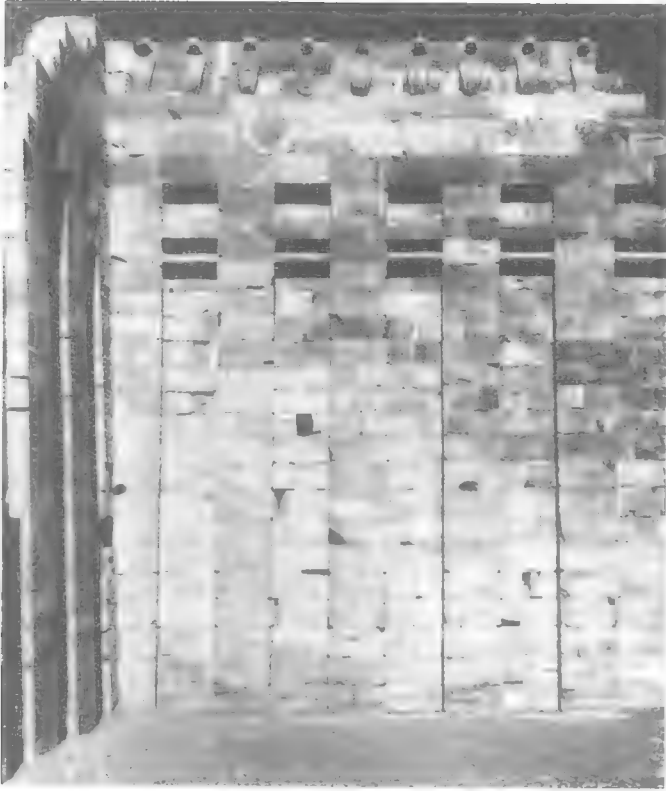
جدار مقصورة مزدانة بحيات الكوبرا ، رممها لويز حجراً بحجراً